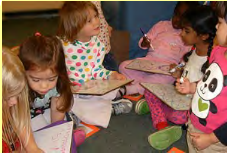
Center for Young Children

웹사이트: http://www.education.umd.edu/EDHD/CYC/