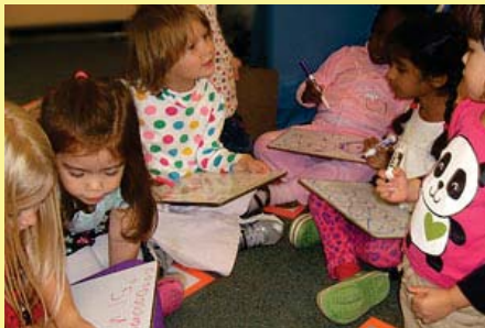
Center for Young Children College of Education Department of Human Development & Quantitative Methodology

웹사이트: http://www.education.umd.edu/EDHD/CYC/